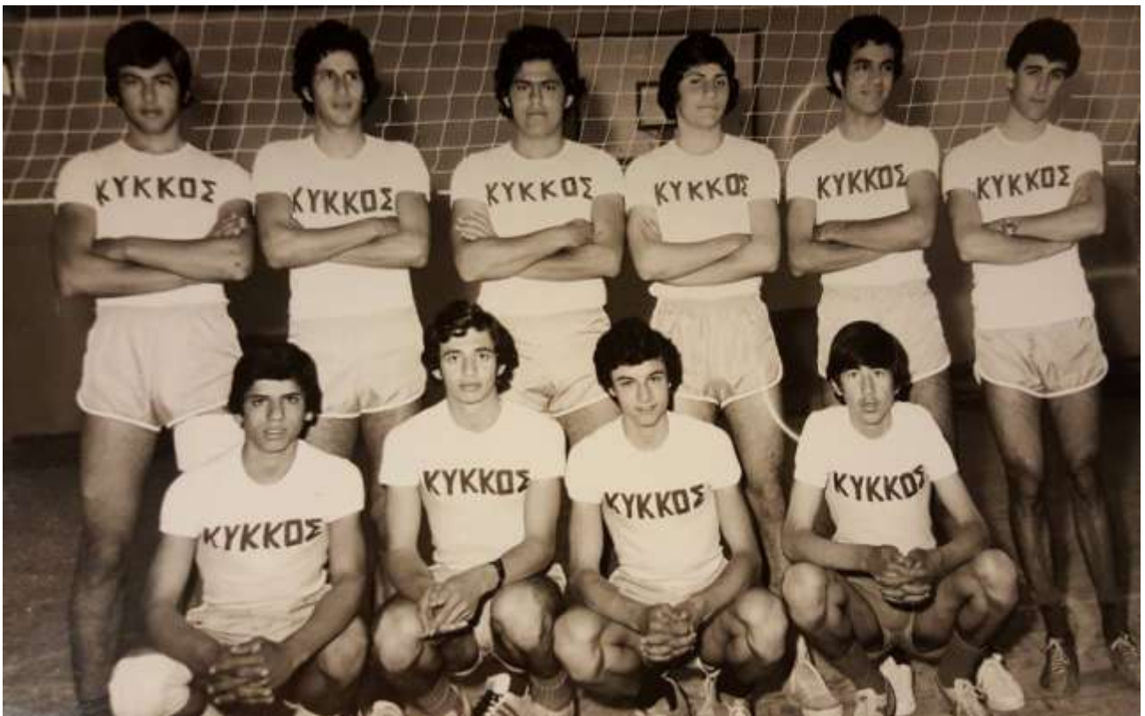
Η ομάδα του Γυμνασίου Κύκκου όπως αγωνιζόταν το 1976 στο Παγκόσμιο πρωτάθλημα