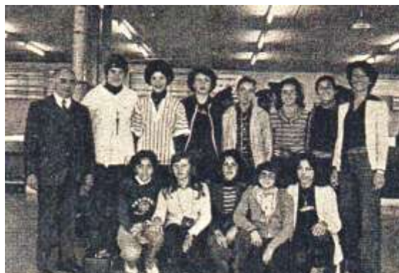
Ομάδα του Λυκείου Λάρνακας που κέρδισε τη πρώτη νίκη στο Πανελλήνιο Μαθητικό Πρωτάθλημα Πετοσφαίρισης το 1978

Αγαπητοί φίλοι, χαρείτε την παραμονή σας εδώ θεωρώντας ότι βρίσκεστε σε δικό σας χώρο.